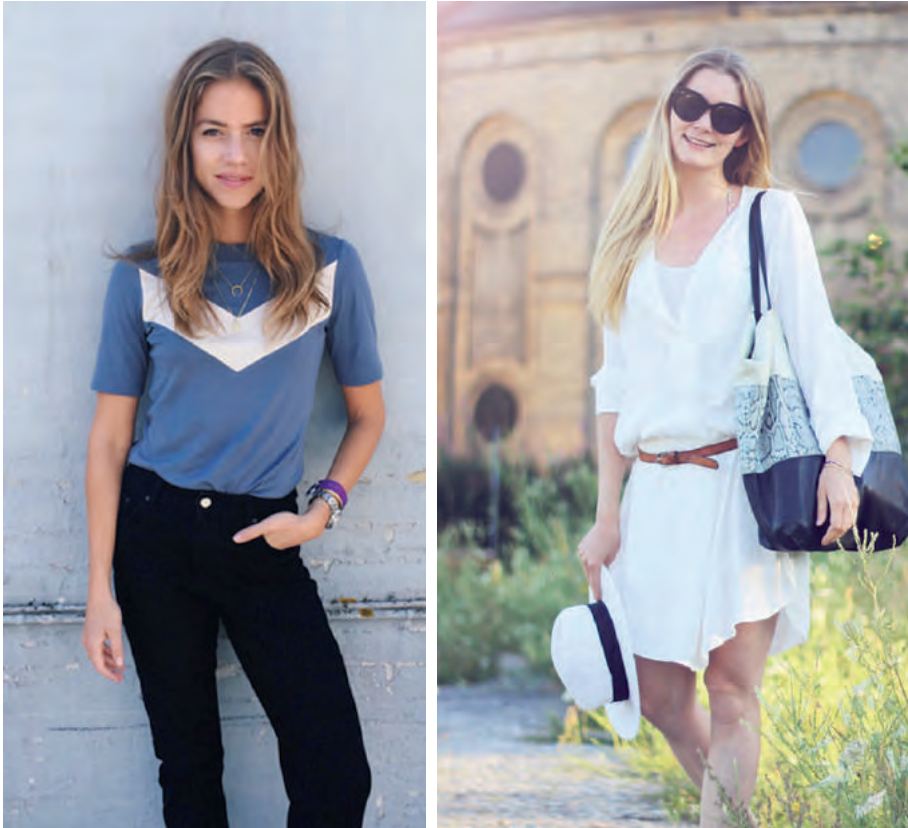
BILLEDER: FRA PASSIONS FOR FASHION OG TRINES WARDROBE

Den typiske danske modeblogger er en kvinde i tyverne, og i det hele taget er fordelingen på bloggernes køn meget ensidig, da ganske få mænd er modebloggere. Den danske modeblogosfære kan således også siges at være et feminiseret rum. Både et rum, hvor værdier og adfærd, som historisk er koblet til det feminine, dyrkes og praktiseres, men det er også et rum, hvor anerkendelse lader til at være den primære interaktionsform. Læserne roser bloggerne, og bloggerne roser læserne. Bloggens læsere bruger ofte modebloggeren som et (forbrugs- og mode)forbillede, spejler sig i bloggerne og bruger dem som forbrugsrådgivere. Hvilket mærke skal man købe, hvor finder man de jeans etc. Hvis der alligevel skulle opstå et konfliktforhold, bliver kommentarsporet stedet, hvor en konflikt kan udspille sig. Kommentarsporene er således en vigtig del af modebloggen (og bloggen generelt), hvor en væsentlig del af bloggernes tekstkorpus