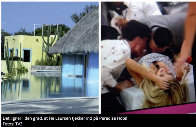
BILLEDER: SPEKULATIONER I ARTIKEL FRA SE OG HØR 50