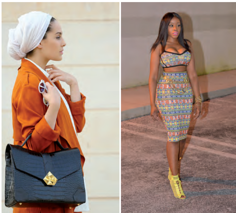
BILLEDER: SCREENSHOTS FRA (VENSTRE MOD HØJRE) THE HYBRID HEADPIECE OG STYLE FLUENCY

I forhold til hvordan modeblogs ser ud i en global sammenhæng, er det danske bloggerfelt forholdsvis homogent. I britisk og amerikansk sammenhæng findes der store kommercielle modeblogs, dedikeret til mode for kvinder, der går med tørklæde (fx britiske www.hijabstyle.co.uk eller kuwaitisk-amerikanske www.hybridheadpiece.com ), eller afrikansk-amerikansk identitet (fx amerikanske www.stylefluency.com og ligeledes amerikanske www.pocketsandbows.com ). Ligeledes findes der globalt set langt flere mandlige modebloggere, bloggere med et handicap og andre minoriteter repræsenteret.