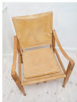
KAARE KLINT "SAFARISTOLEN"

Jeg manglede et lædermøbel i min stue, og denne ikoniske og tidsløse stol af Kaare Klint, designet i 1933, havde længe stået på ønskelisten. Derfor valgte jeg at investere i en brugt af slagsen, som har fået godt med patina og derfor, efter min mening, fremstår smukkere end fra ny. Generelt set synes jeg, at lædermøbler er smukkeste, når de har fået noget alder og liv, og anbefaler klart at lede efter lædermøbler secondhand.