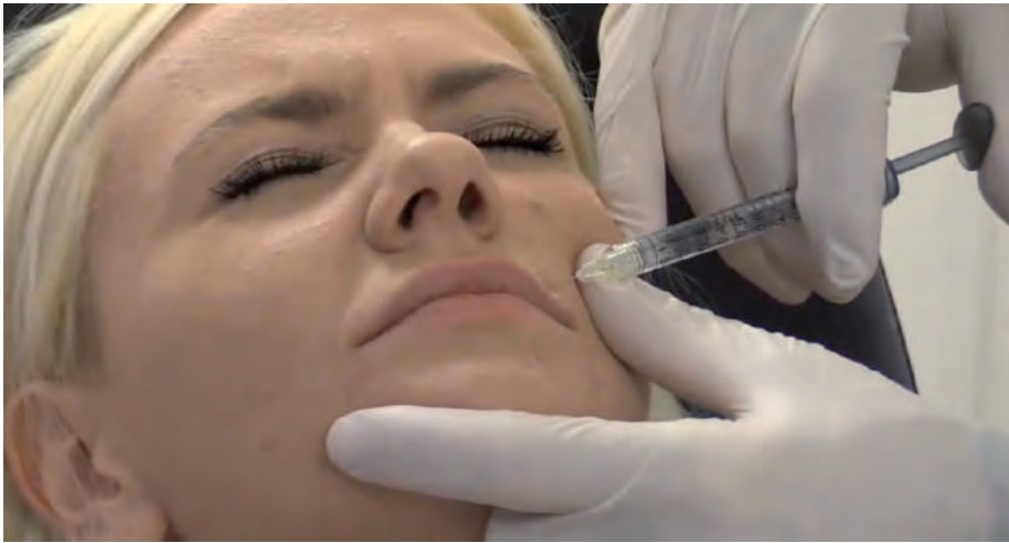
85