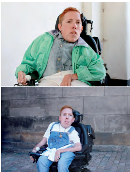
BILLEDE: FRA WHERE FASHION IS FASHION IS