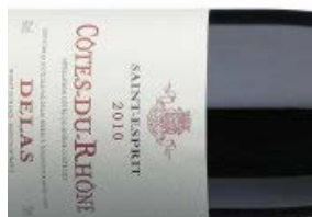
Vintest: Jorden rundt med spegepølsedruen