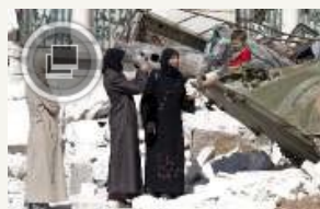
De bedste skud i verden