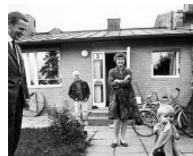
Prisen for at være Palme