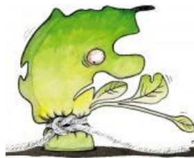
Konservativ muld og liberal frihed