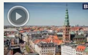
Hot dogs er hottere end havfruen