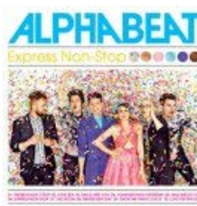
Alphabeat er som en kulørt drink