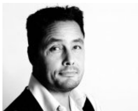
Klumme: Undskyld jeg rørte