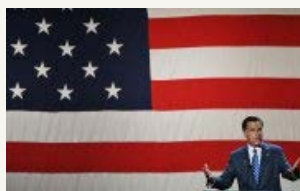
Carters barnebarn hævnede sig på Romney