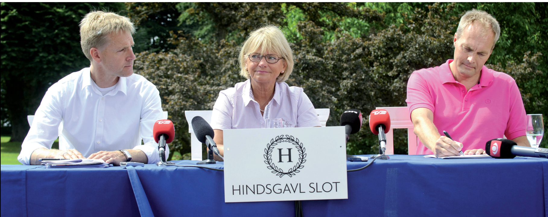
▲ Dansk Folkeparti holder sommergruppemøde på Fyn. Her er det fra venstre Kristian Thulesen Dahl, Pia Kjærsgaard og Peter Skaarup.